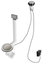
Desagüe automático Space Light 8407 117