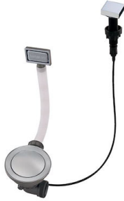
Desagüe automático Space 8407 108